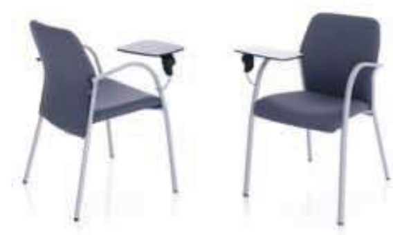
Pala de escritura fenólica Tablette d'écriture phénolique Phenolic writing tablet