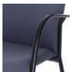
Estructura epoxi negro Structure époxy noir Black epoxy metal frame