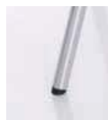
Deslizante trasero inclinado Pièce derrière inclinée Rear piece inclined