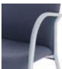
Estructura metálica gris plata Structure métallique gris argentée Silver grey metal frame