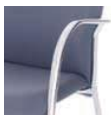
Estructura metálica cromada Structure métallique chromée Chromed metal frame