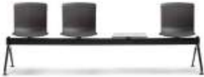
Polypropylene Polipropileno Polypropylène