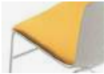
Upholstered seat Asiento tapizado Placet rembourré et tapissé