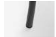
Black Negro Noir