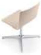
Wood Madera Bois