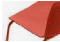
Red Rojo Rouge