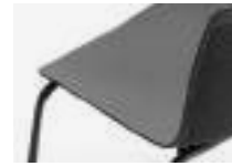
Black Negro Noir