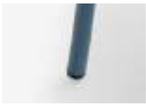
Blue Azul Bleu