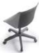
Polypropylene Polipropileno Polypropylène