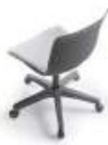
Upholstered seat Asiento tapizado Assise tapissé