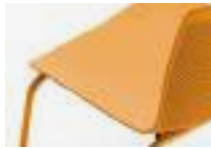
Orange Naranja Orange