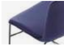
Upholstered shell Monocasco tapizado Monocoque entièrement tapissée