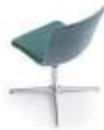
Upholstered shell Carcasa tapizada Monocoque tapissé