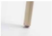
Beech Haya Hêtre