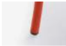
Red Rojo Rouge