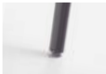
Smoked ash Fresno ahumado Frêne fumé