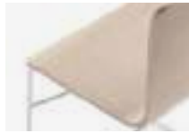
Beech wooden Madera haya Bois finition hêtre