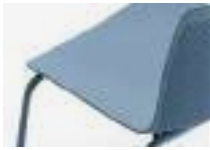
Blue Azul Bleu