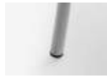
Silver grey Gris plata Gris argent