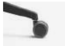
Black Negra Noire