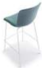
Upholstered shell Carcasa tapizada Monocoque tapissé