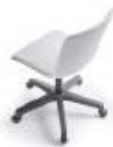
Upholstered shell Carcasa tapizada Monocoque tapissé