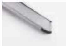
Polished aluminium Aluminio pulido Aluminium poli