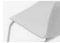
Polar white Blanco polar Blanc polaire