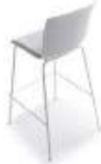
Upholstered seat Asiento tapizado Assise tapissé