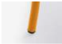
Orange Naranja Orange