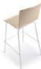
Wood Madera Bois