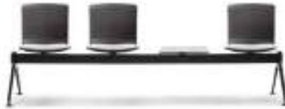
Upholstered seat Asiento tapizado Assise tapissé